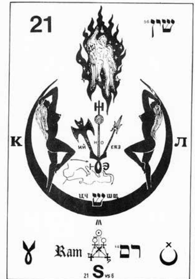
Le Tarot de l'Etoile